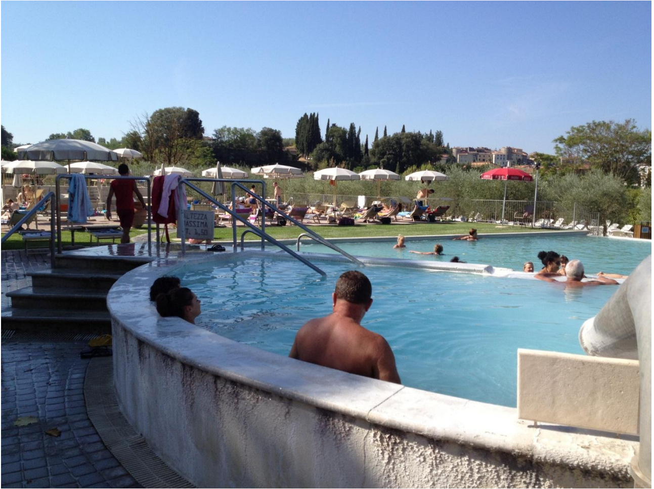
15/08/12 Rapolano Terme "L'Antica Querciolaia"

Verso sera, decidiamo di abbandonare la Toscana e dirigerci verso l'Umbria, verso la capitale dell'Umbria ... Perugia . Dopo un'ora di viaggio raggiungiamo la meta e troviamo accoglienza presso un piccolo campeggio al limitare del centro abitato "Camping il Rocolo". Piccolo, ombreggiato, con tanto di piscina, ci permette di trascorrere una notte fresca e silenziosa.