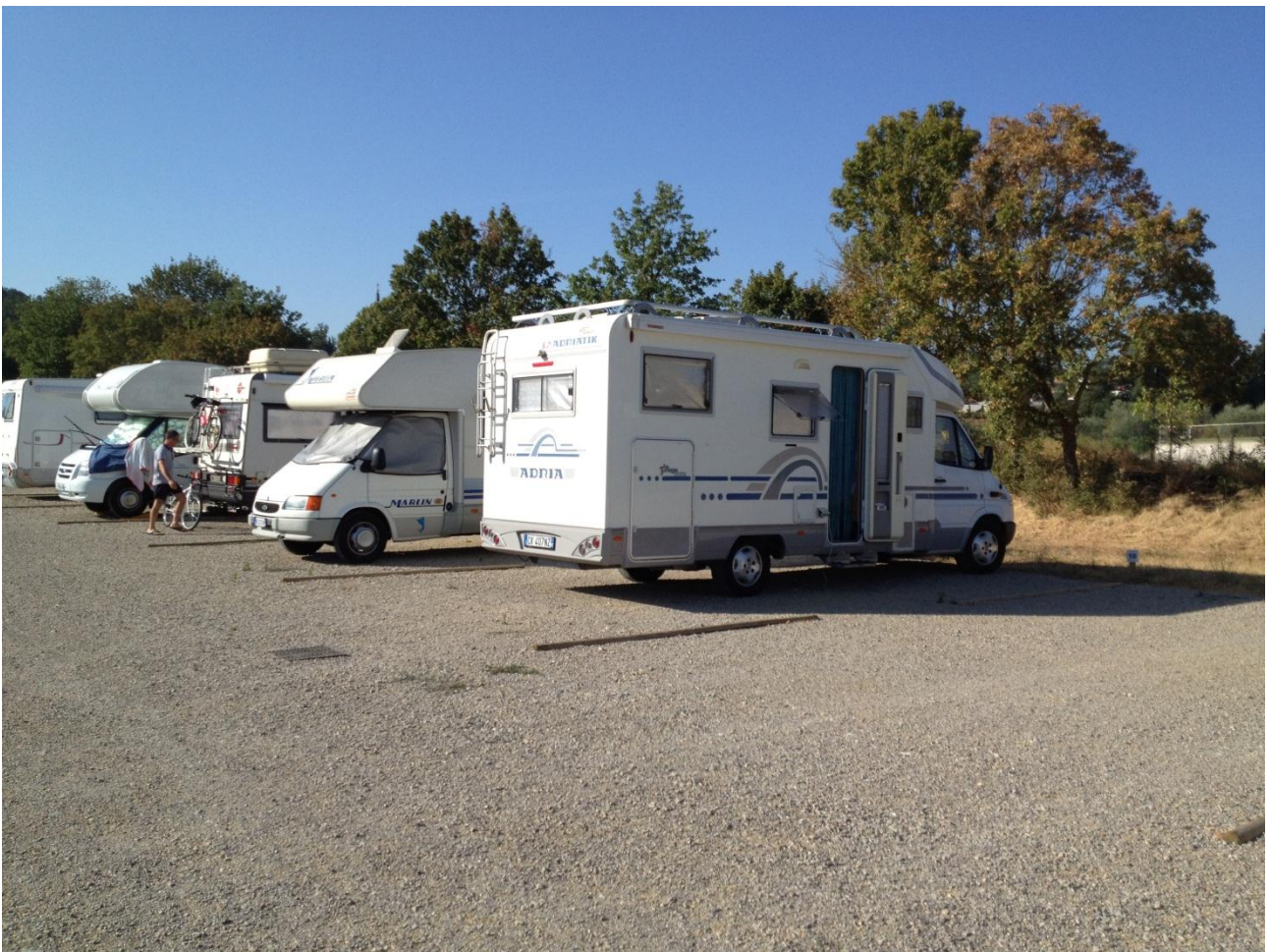
14/08/12 RAPOLANO TERME Area sosta camper adiacente alle terme "L'Antica Querciolaia"

Partenza quindi da Tortona, martedì 14 agosto nel primo pomeriggio, con prima meta stabilita a Rapolano Terme (SI). Seguiamo il portolano che ci conduce senza alcun intoppo all'area di sosta camper prospiciente allo stabilimento termale "L'antica Querciolaia". Ci aspetteremmo di trovare i servizi igienici come indicato sul portolano, ma non è così, sono ancora in fase di allestimento. (questa non è l'unica inesattezza che riscontreremo sul portolano, cari amici camperisti, verificate sempre prima, magari con una telefonata, se quanto scritto corrisponde al vero).