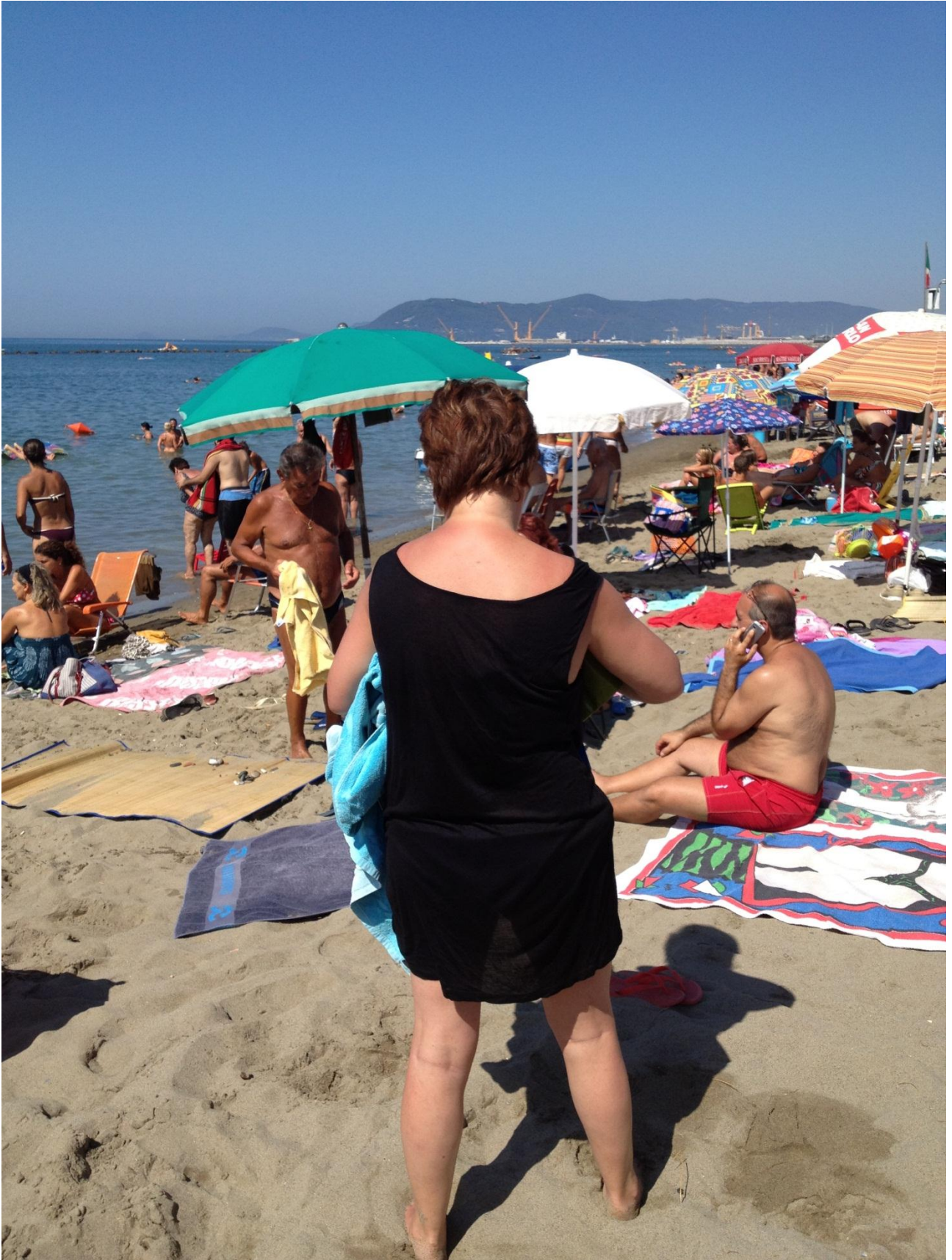
22/08/12 Marina di Massa altra veduta della spiaggia