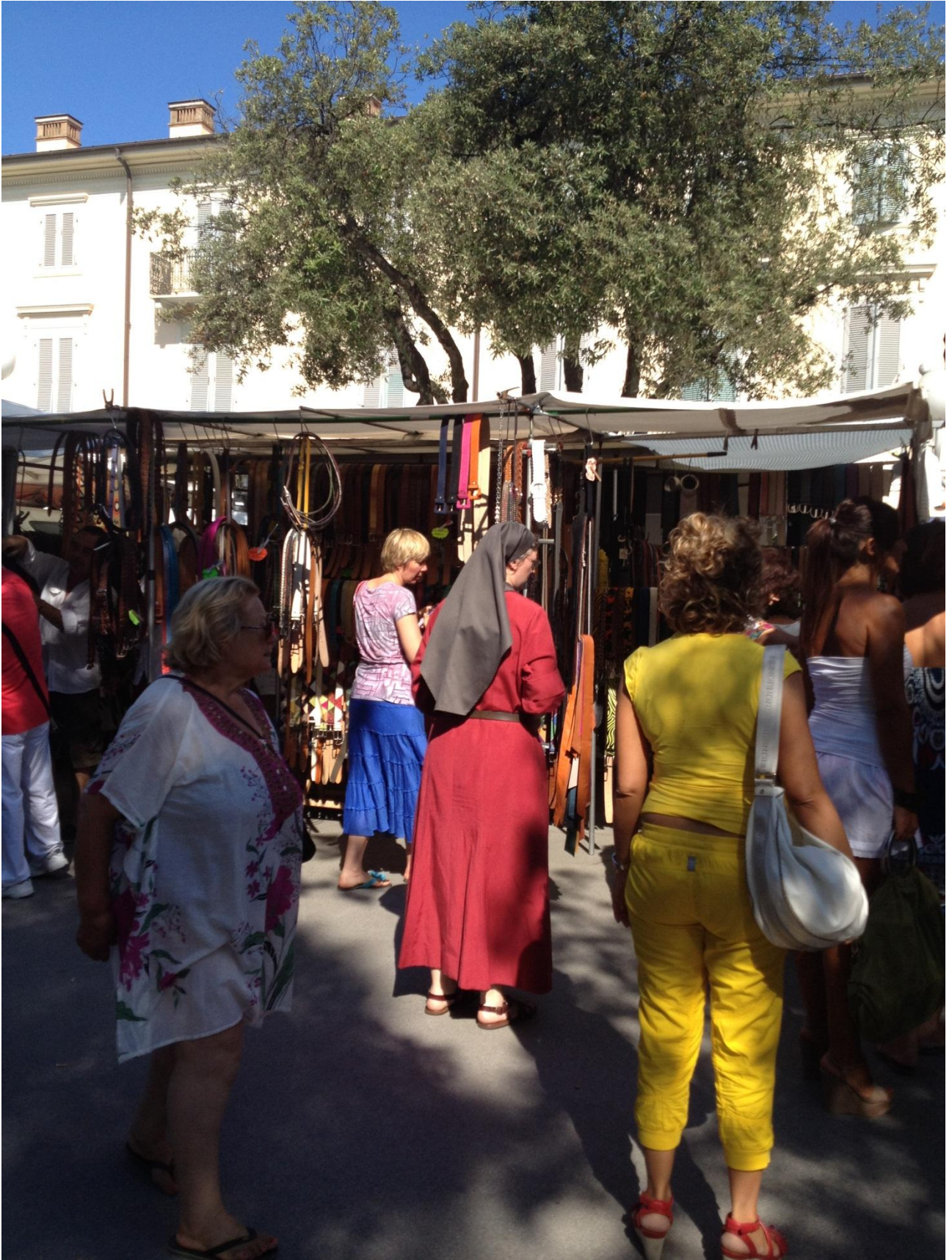
22/08/12 Forte dei Marmi anche le suore al mercatino del mercoledì