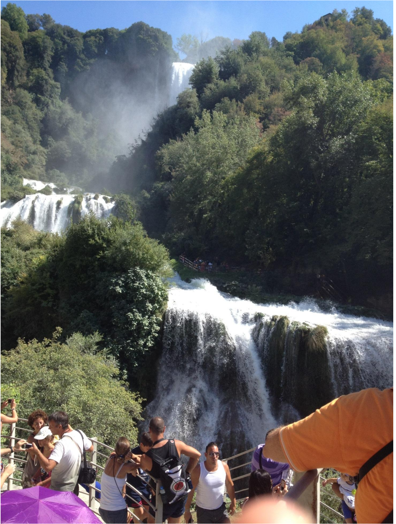
18/08/12 Cascata delle Marmore