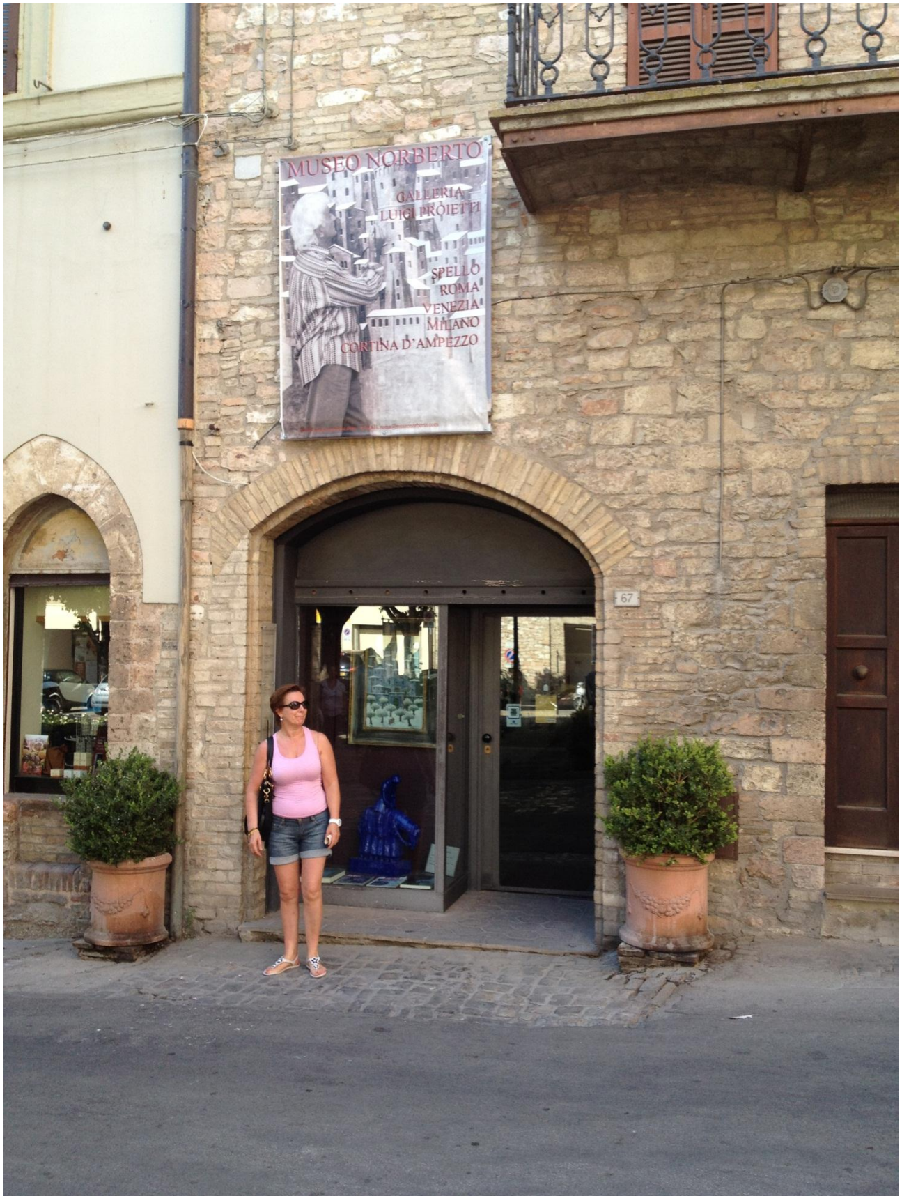
16/08/12 Spello ..... mi stupisce il nome del museo ..... che è quello di mio fratello