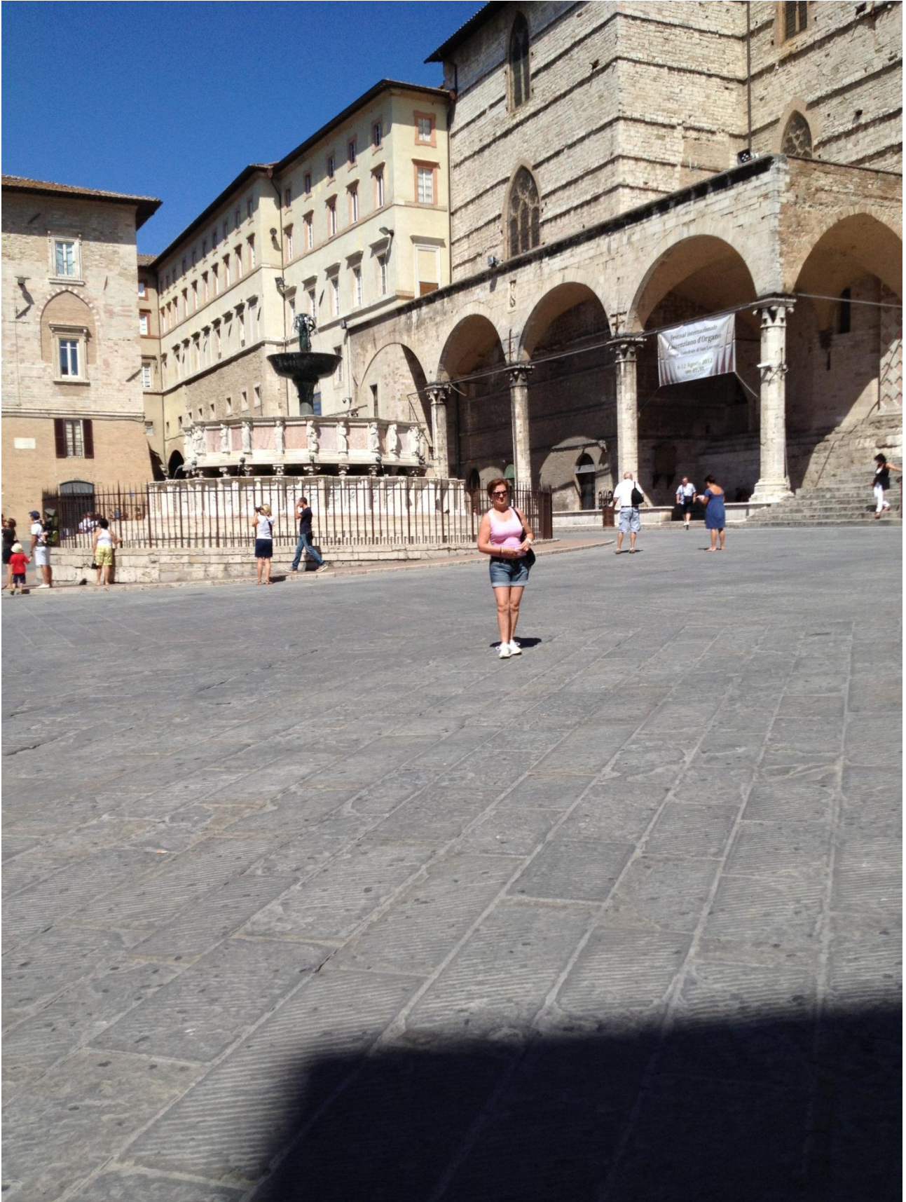
16/08/12 Perugia Fontana Maggiore

Proseguiamo il viaggio verso sud dove troveremo e visiteremo Spello e Spoletto , splendide entrambe, anche se maledettamente calde.