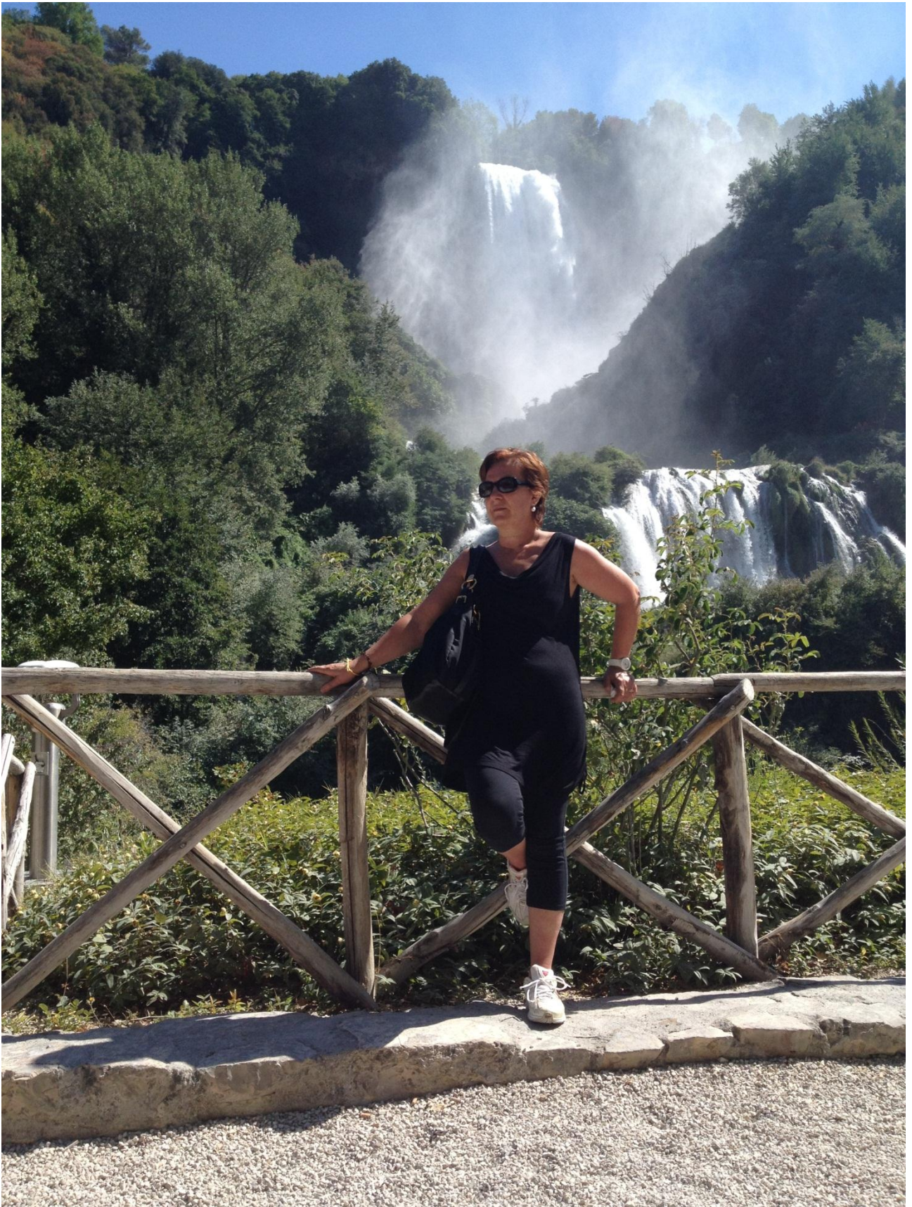
18/08/12 Cascata delle Marmore