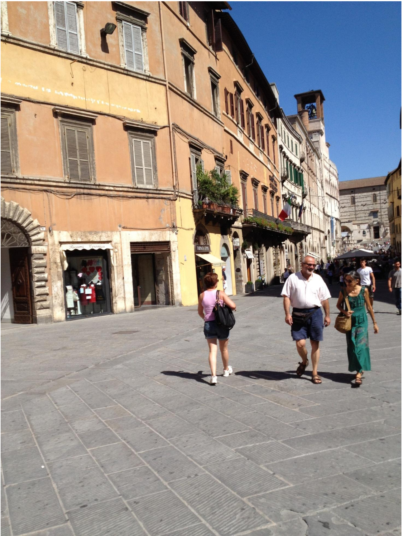
16/08/12 Perugia ..... per le vie del centro storico