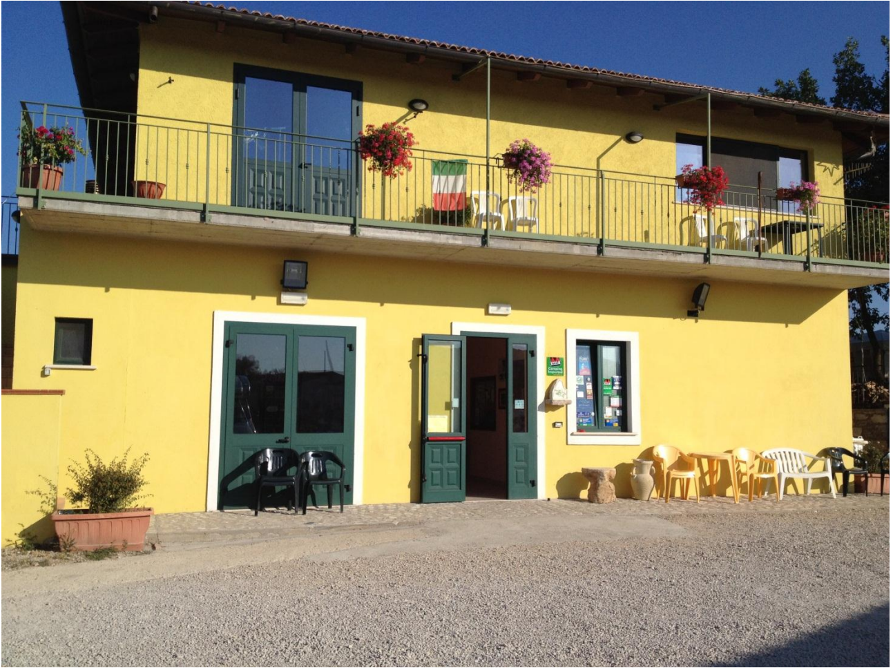
17/08/12 Camping "il Drago" ... reception e ristorante del piccolo campeggio.