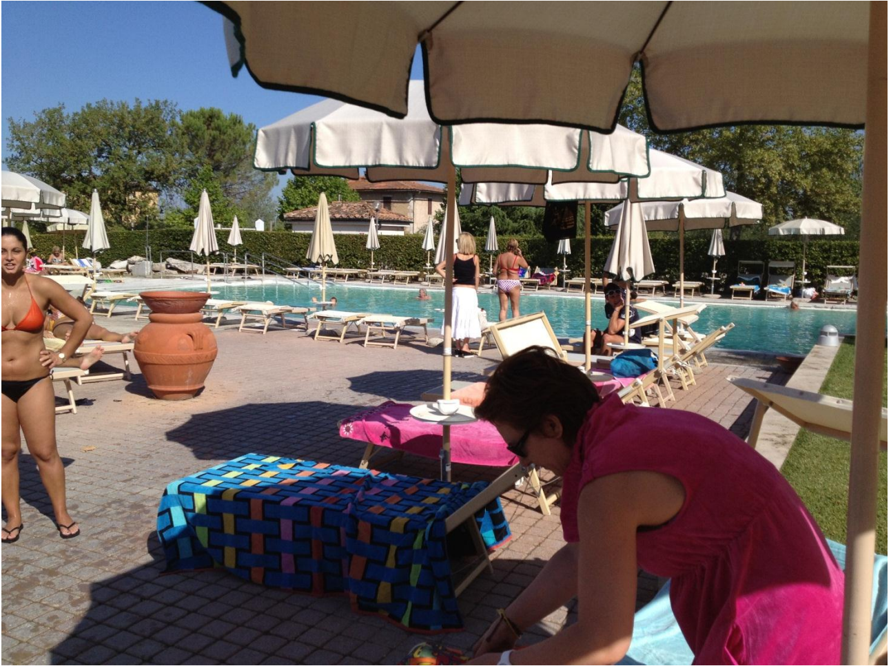
15/08/12 Rapolano Terme "L'Antica Querciolaia"