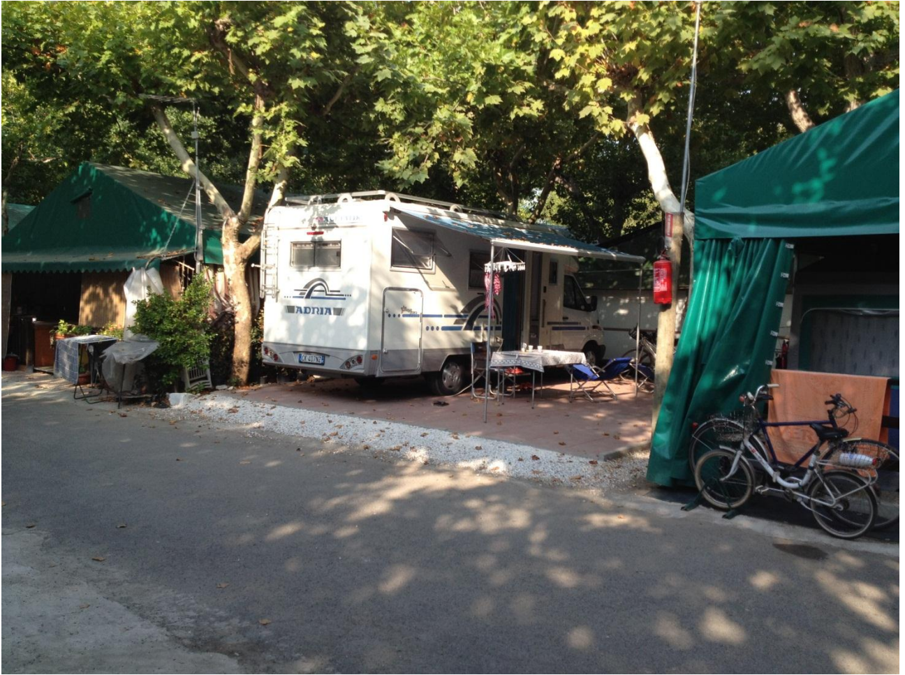
19/08/12 Marina di Massa camping "Città di Massa" la piazzola a noi riservata