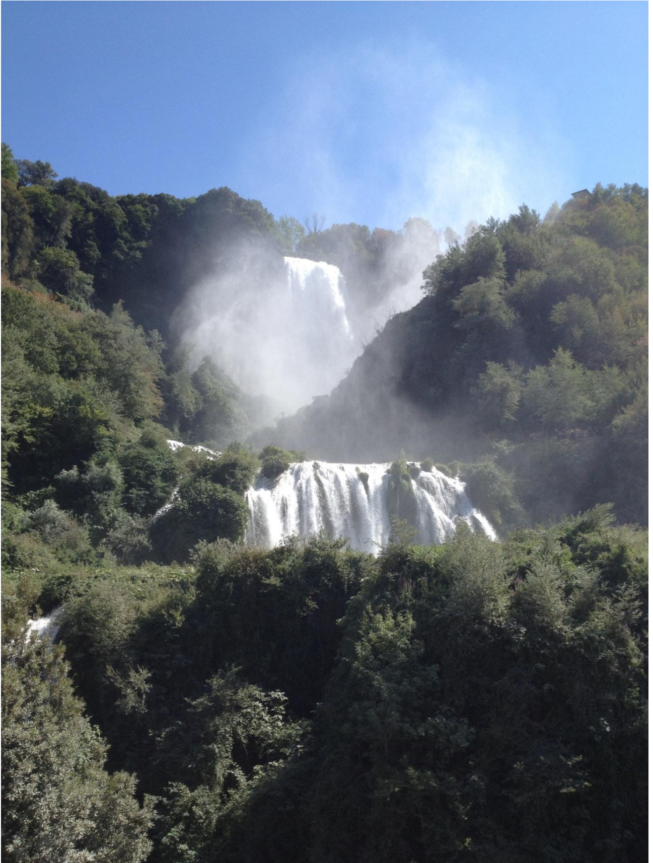
18/08/12 Cascata delle Marmore