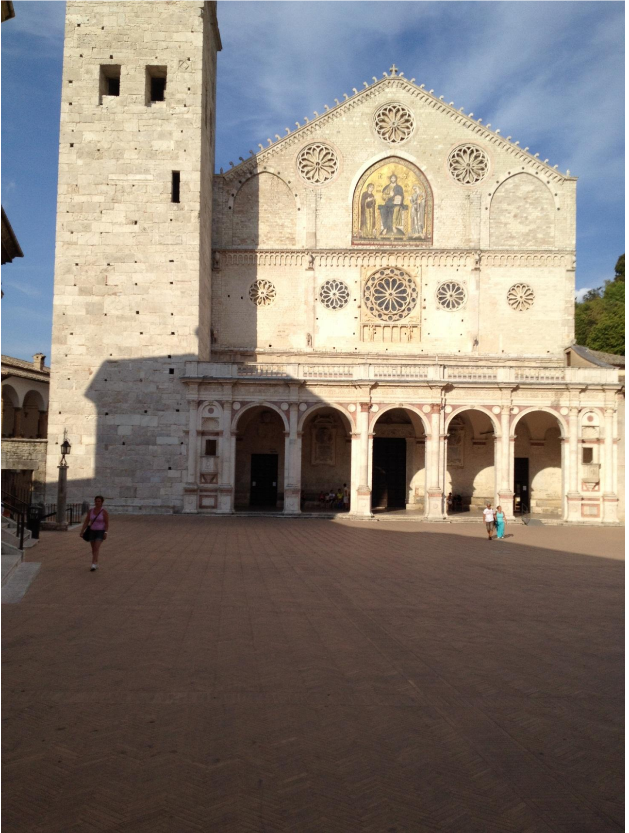
16/08/12 Spoleto il Duomo