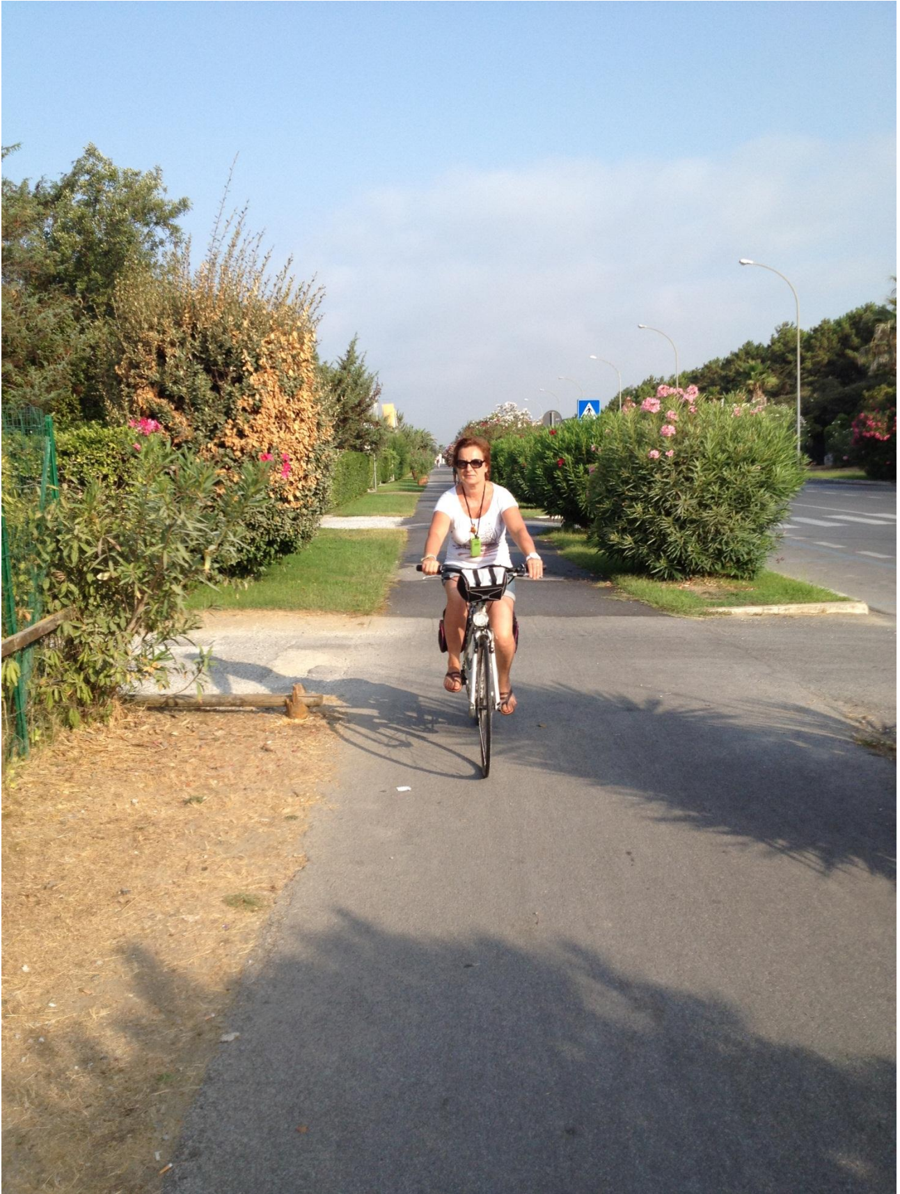
24/08/12 Sulla pista ciclabile della Versilia da Marina di Massa verso Viareggio.