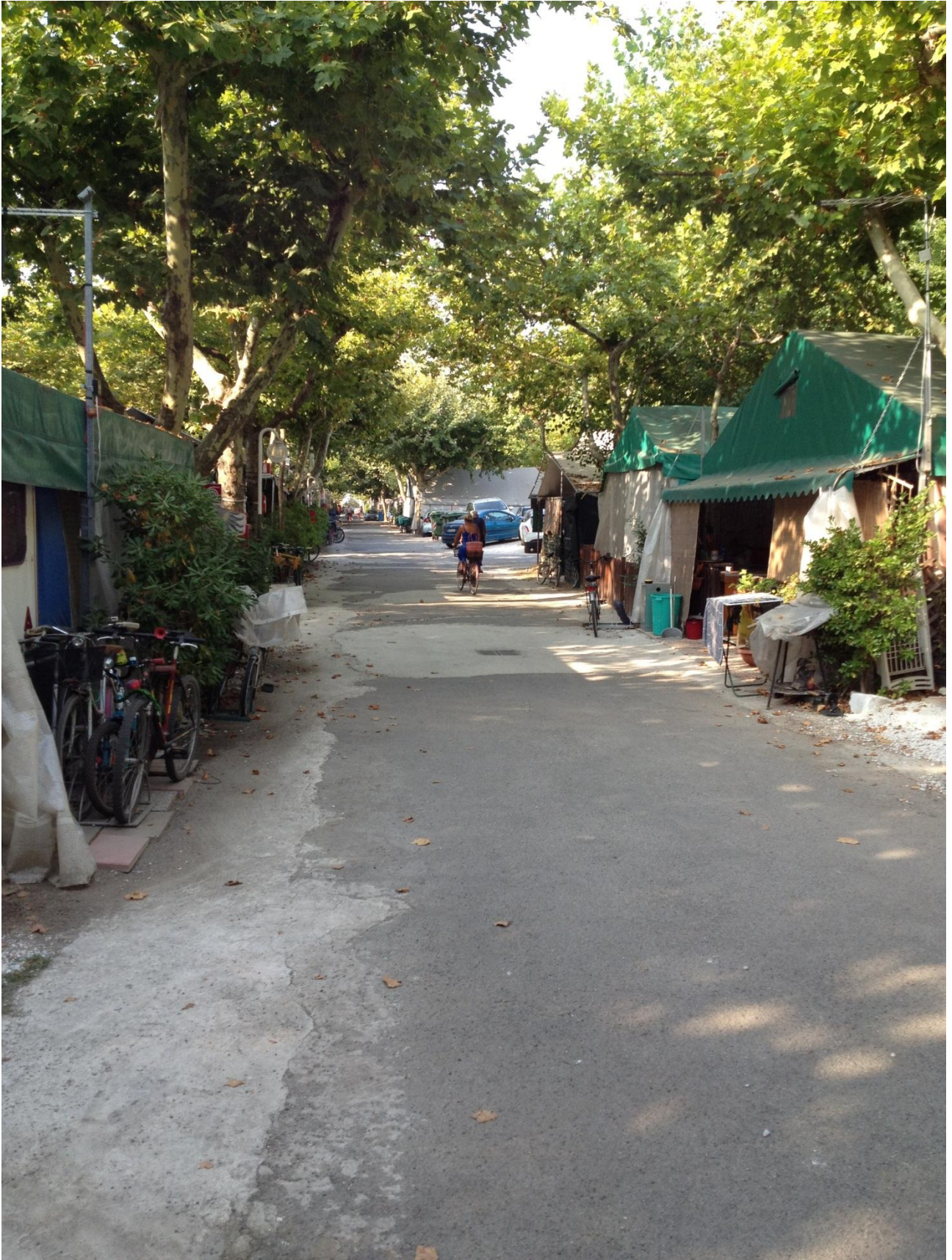
23/09/12 Marina di Massa .... Il lungo viale che attraversa il camping "Città di Massa"