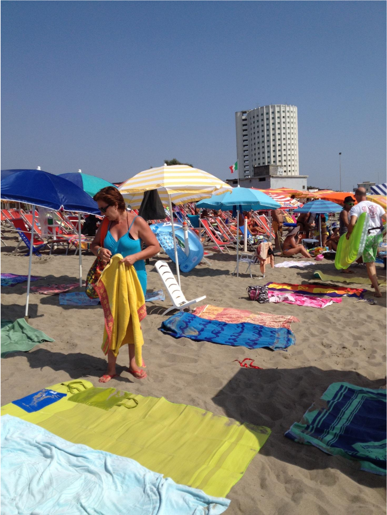
22/08/12 Marina di Massa altra veduta della spiaggia