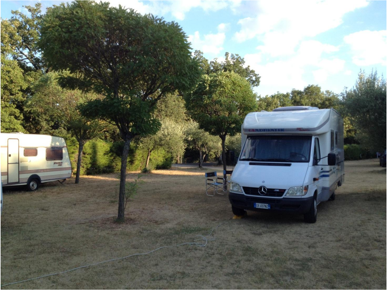
15/08/12 Perugia Camping "il Rocolo"