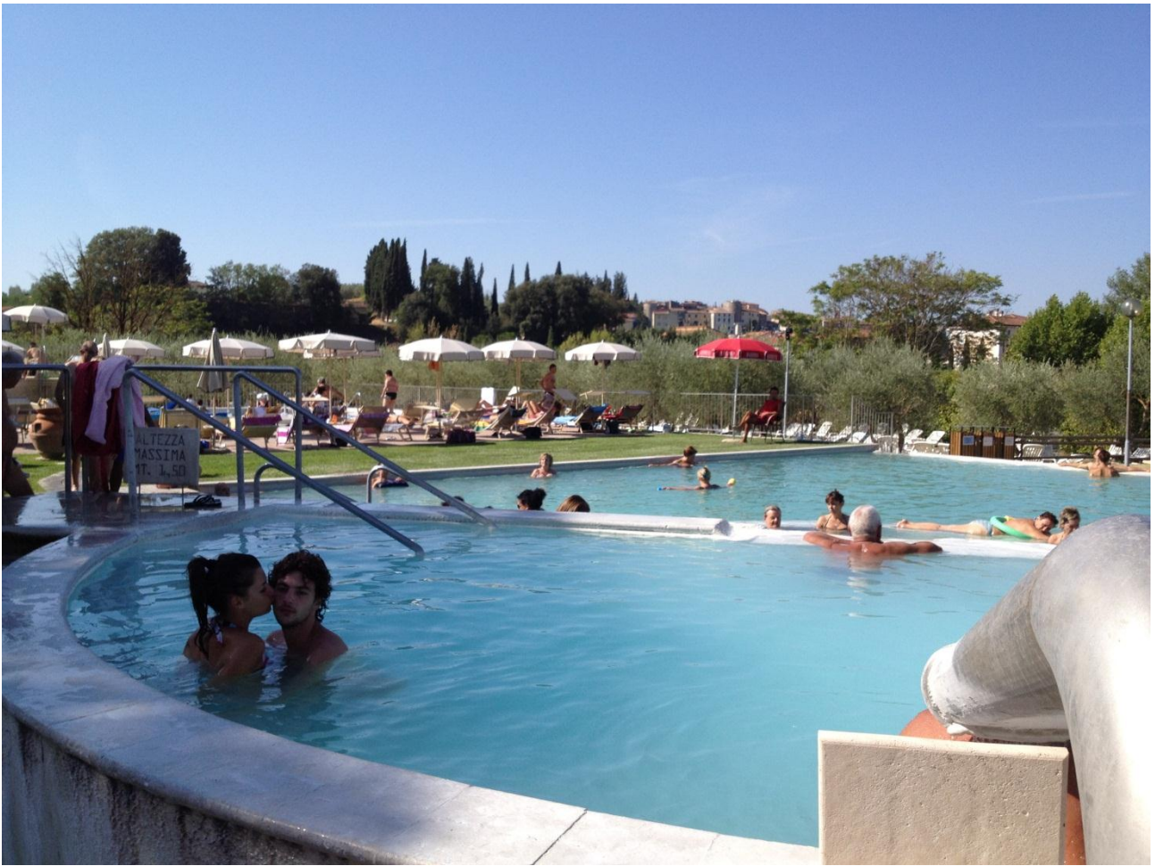
15/08/12 Rapolano Terme Stabilimento termale "L'Antica Querciolaia"