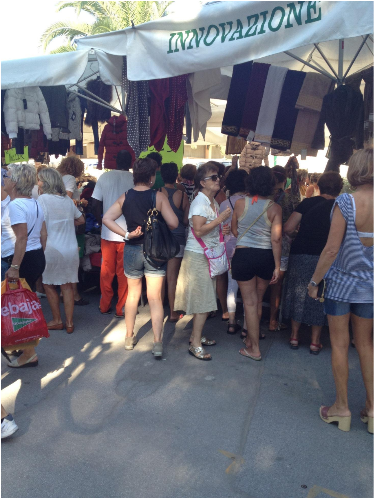
19/08/12 Forte dei Marmi mercatino della domenica