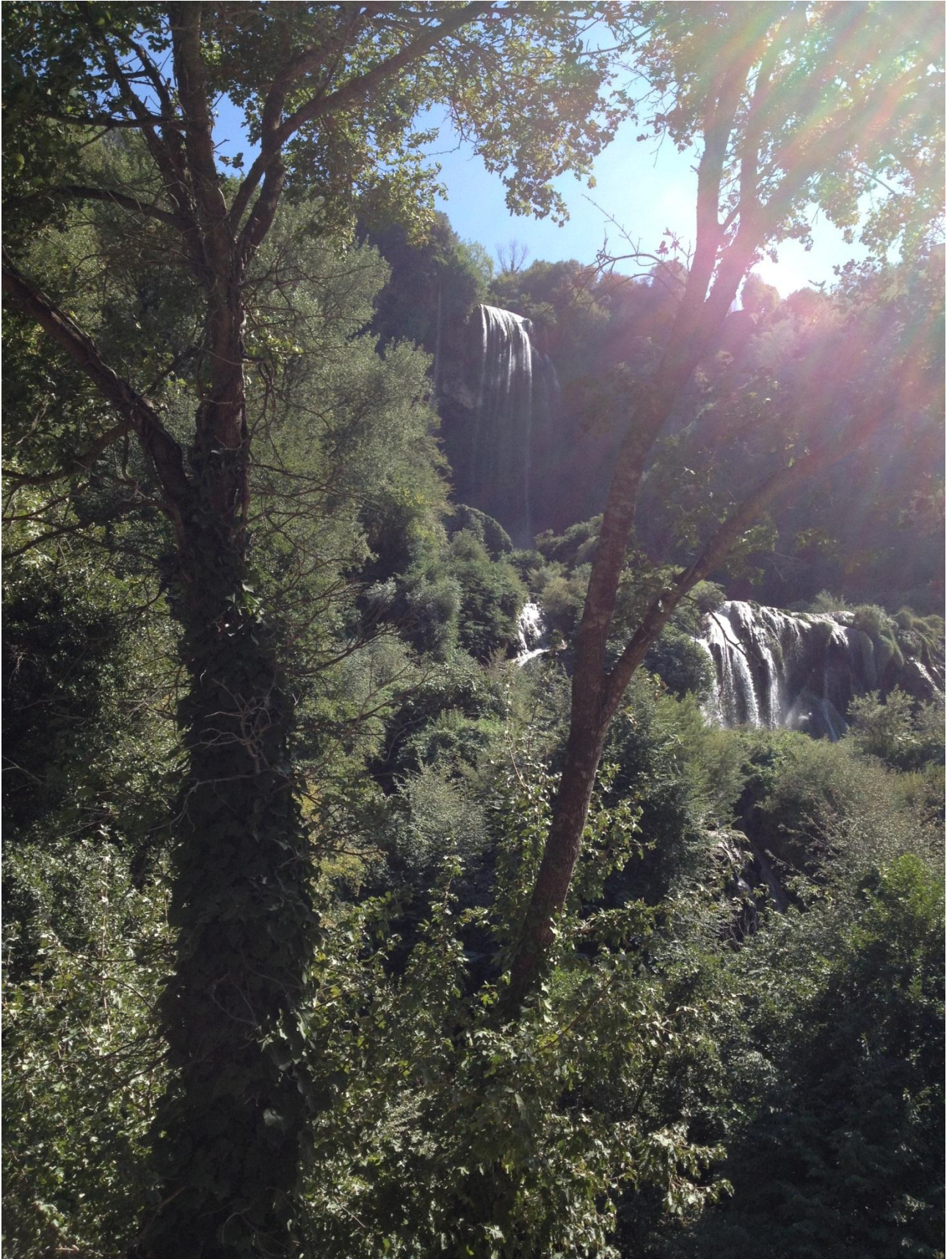
18/08/12 Cascata delle Marmore ..... Prima dell'apertura dell'acqua.