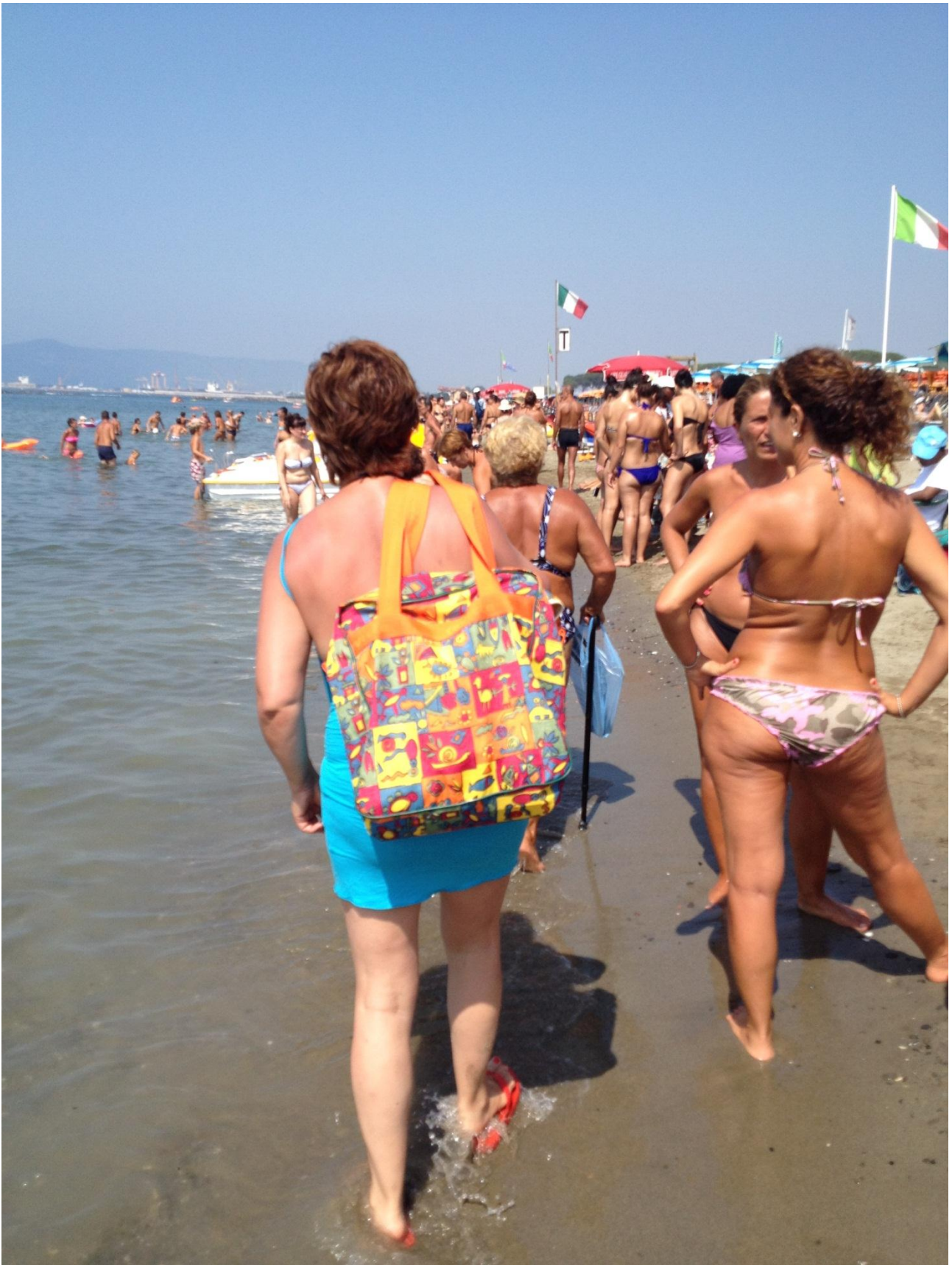
22/08/12 Marina di Massa la spiaggia e la sua folla