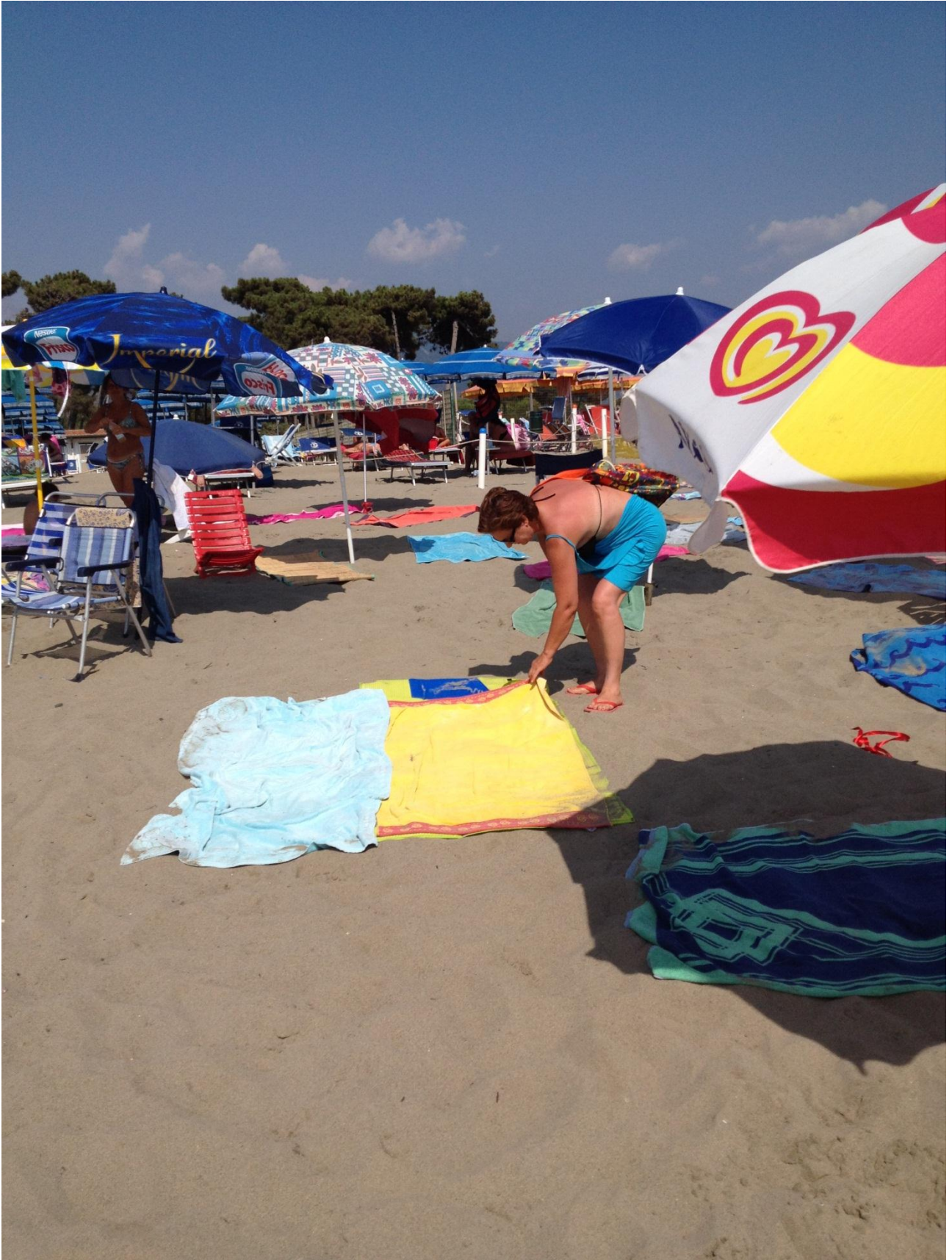
19/08/12 Spiaggia di Marina di Massa (mattino presto)