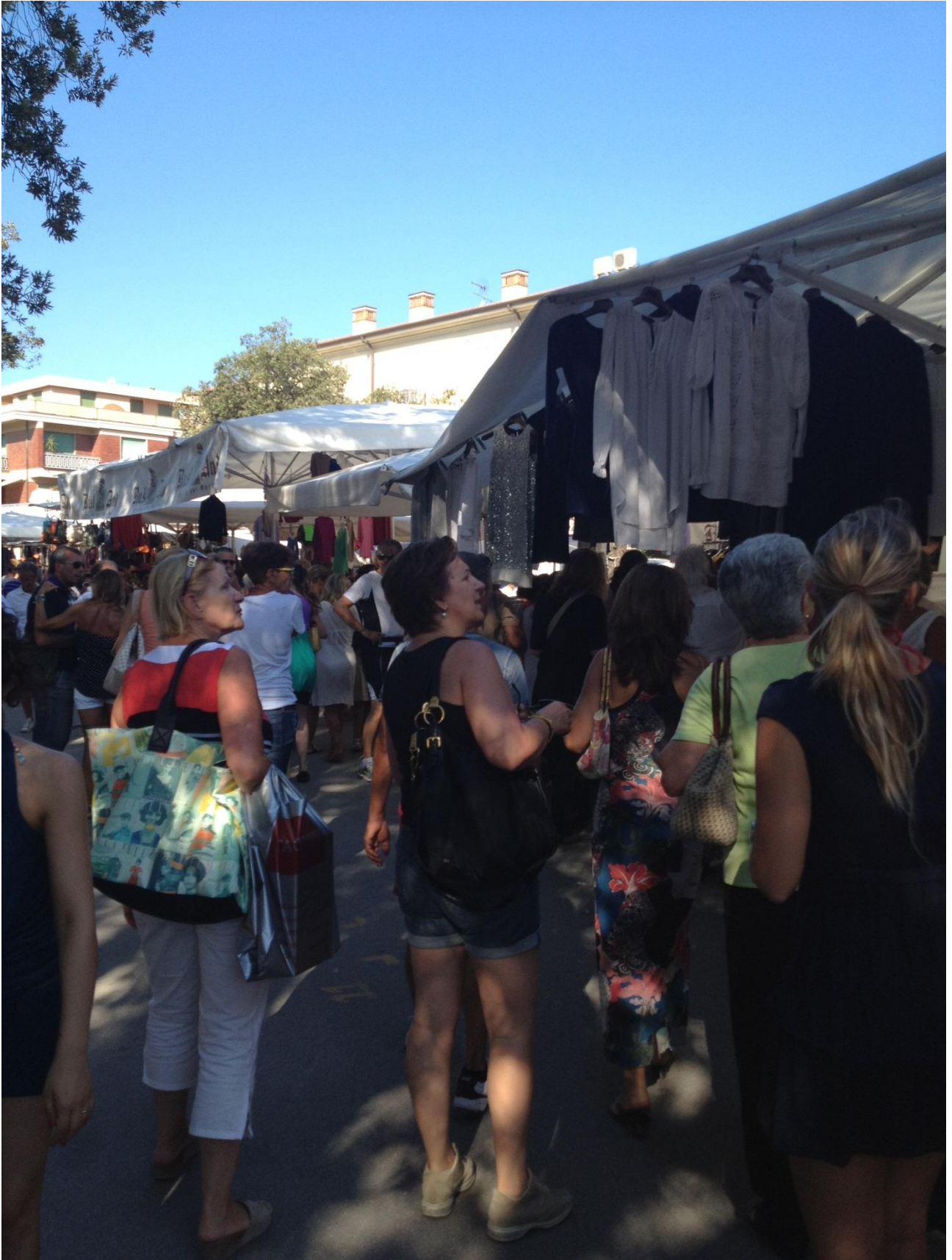
19/08/12 Forte dei Marmi mercatino della domenica.